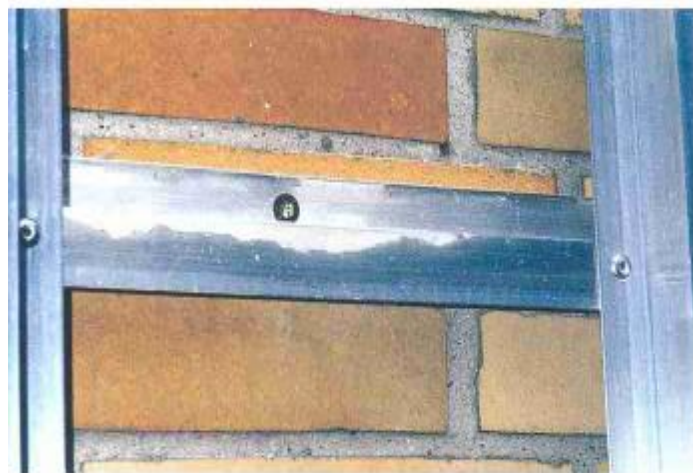
Abb. 4: Verankerte Al-Z-Profile horizontal. Die Verbindung der vertikalen Al-Z-Profile mit den Grundprofilen erfolgte mit Bohrnieten