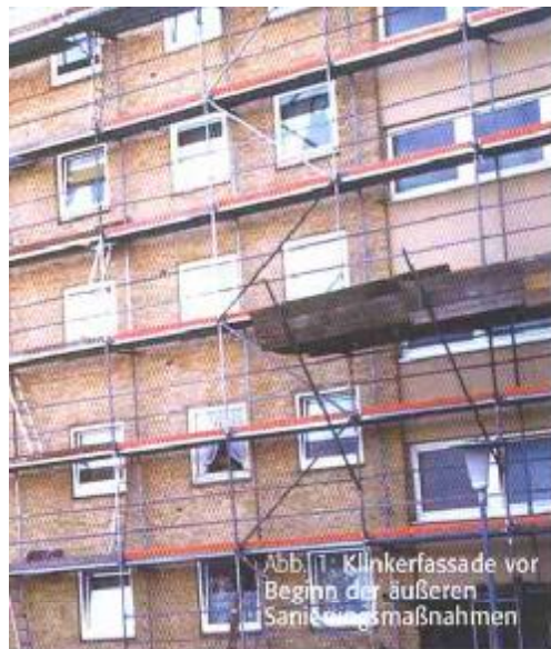
Abb. 1: Klinkerfassade vor Beginn der äußeren Sanierungsmaßnahmen

sehen. Die bekannt bewährten Vorteile dieses Konstruktionsprinzips sollten einerseits die optischen Anforderungen erfüllen (Klinker) und andererseits eine wirtschaftliche Lösung darstellen. Die Bauherrschaft entschied sich für ein System aus Polyester-Fiberglas im Klinkerdesign (Kopfsteinverband).