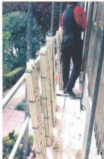
Abb. 5: Die vorgefertigten Fassadenelemente auf dem Gerüst vor der Befestigung an der Al-Unterkonstruktion

Im Bereich der Al-Z-Profile erfolgte die Verbindung mittels SFS-Bohrnieten (Abb. 4 bis 6).