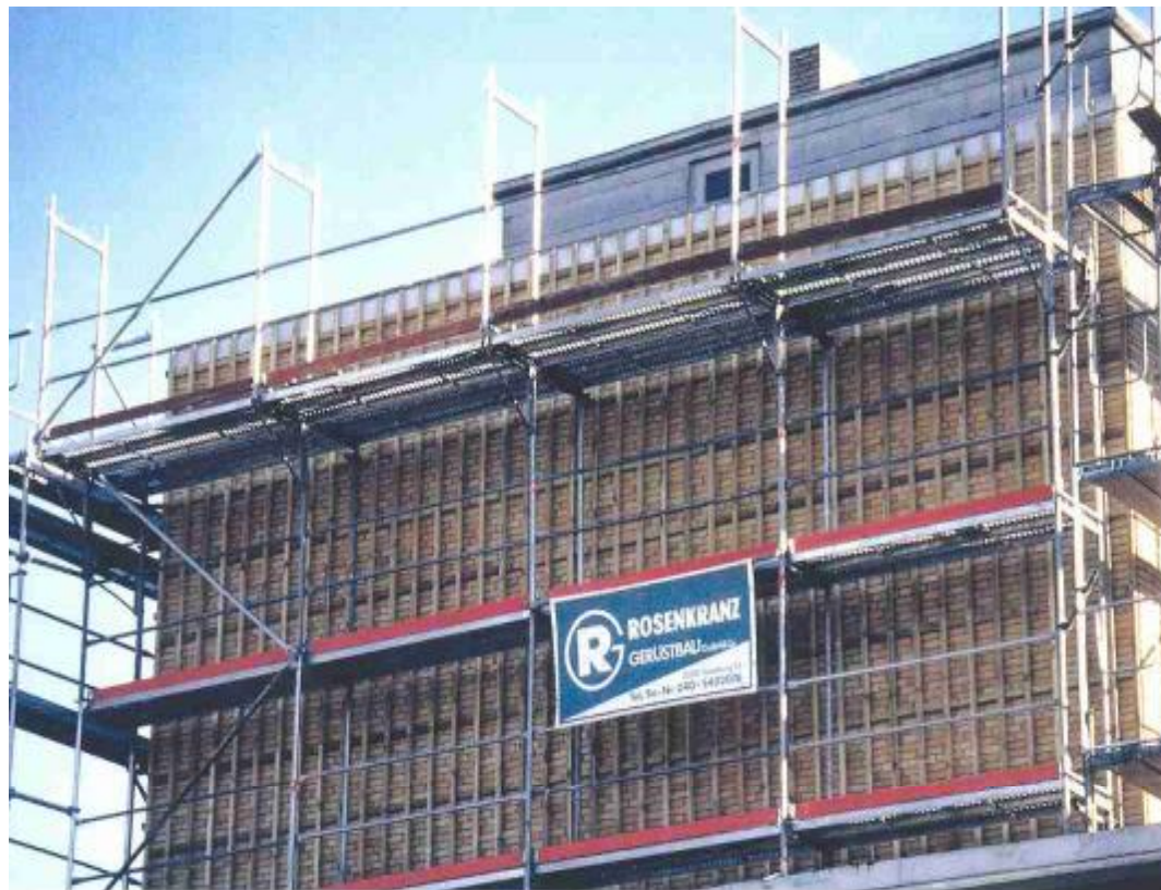
Abb. 3: Imprägnierte Holzunterkonstruktion an den Giebelwänden