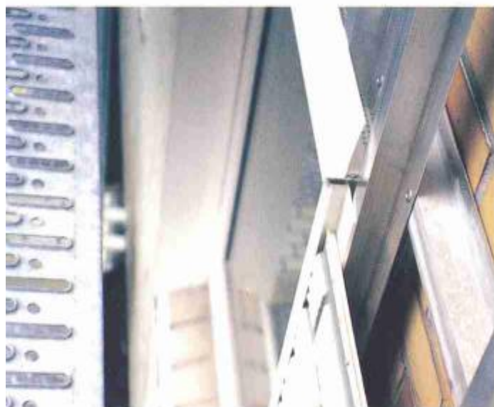
Abb. 6: Seitliche Anschlußlösung mittels Einfußprofil im Fensterbereich